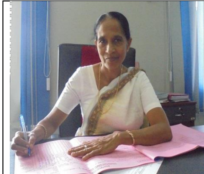
උප පීඨාධිපති පාලන හා මුදල්