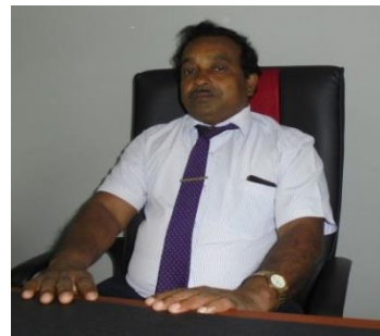
සම්බන්ධීකරණ කථිකාචාර්ය (අධ්යයන හා ගුණාත්මක තහවුරුව)