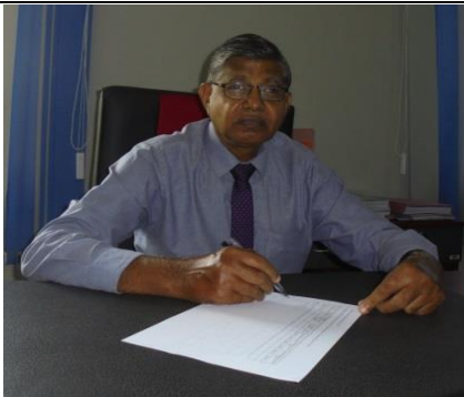
උප පීඨාධිපති අධ්යයන හා ගුණාත්මක තහවුරුව