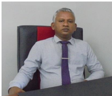
සම්බන්ධීකරණ කථිකාචාර්ය (පාලන හා මුදල්)