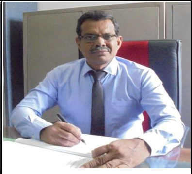
උප පීඨාධිපති අඛණ්ඩ ගුරු අධ්යාපන